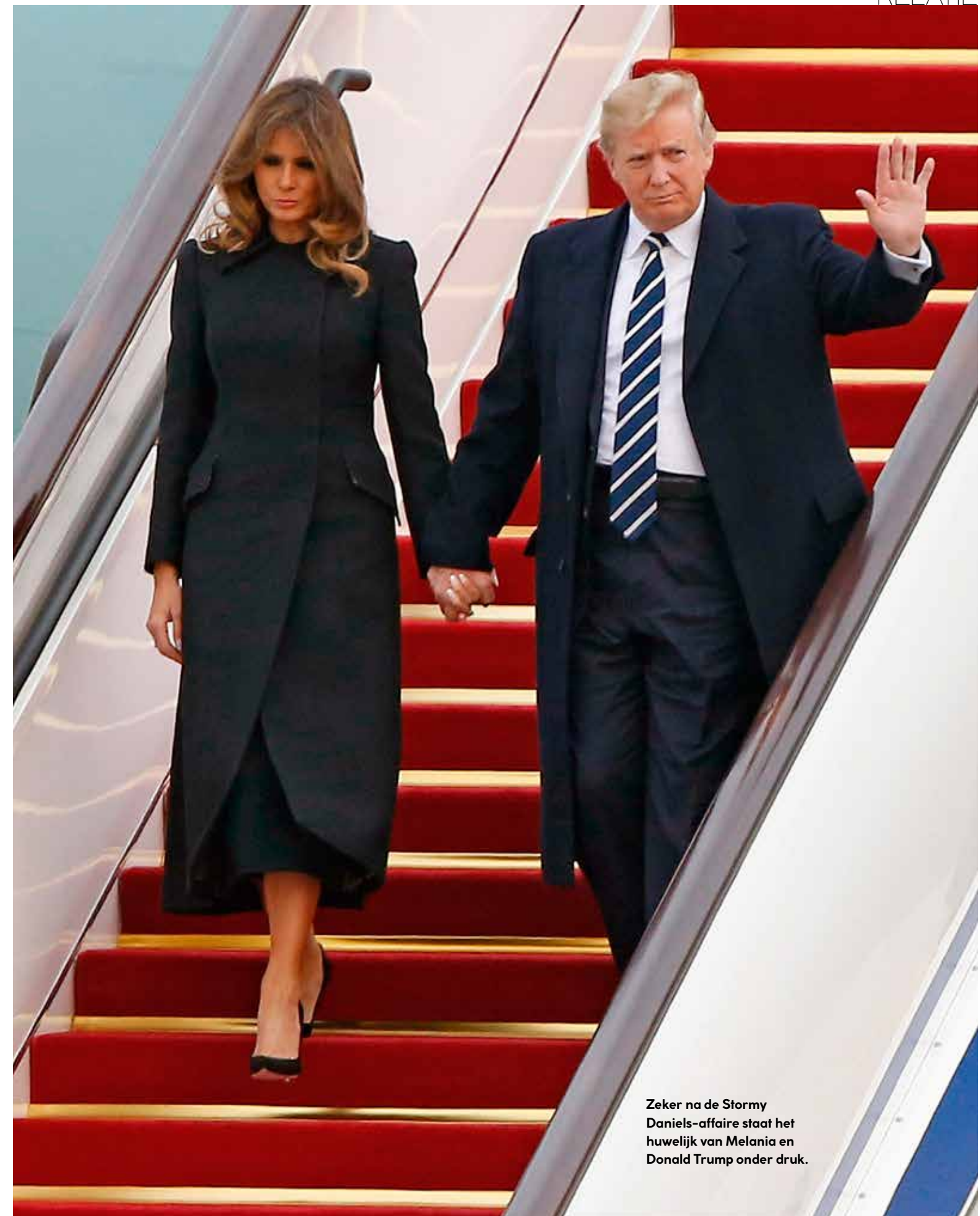
Zeker na de Stormy Daniels-affaire staat het huwelijk van Melania en Donald Trump onder druk.