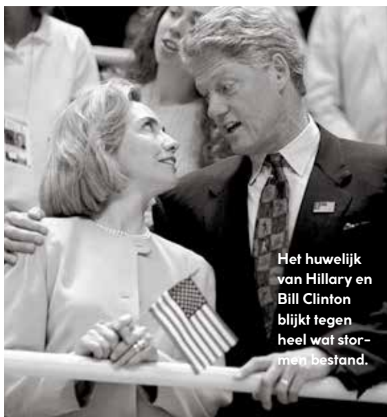
Het huwelijk van Hillary en Bill Clinton blijkt tegen heel wat stormen bestand.

andersom: te snappen dat een kleine flirt in een café niet het einde van de wereld voor jou hoeft te betekenen. In de praktijk wordt dit soort gesprekken meestal pas achteraf gevoerd, op de bank van de therapeut. Zo veel overspeligen, zo veel motieven en oplossingen voor de problemen, zo lijkt het na lezing van Liefde in verhouding . Het is de prijs die we betalen voor onze totaalrelaties van tegenwoordig: we streven naar meer zekerheid en betrouwbaarheid bij onze partner, maar moeten daar spanning en hartstocht voor inleveren. Zie daar het evenwicht maar eens in te vinden. ■